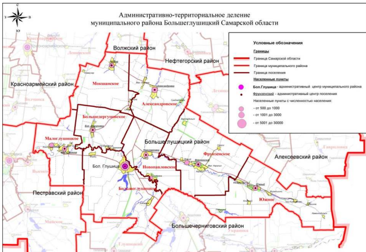
Рис.1 Административно-территориальное деление муниципального района Большеглушицкий Самарской области.

Сельское поселение Мокша расположено на севере муниципального района Большеглушицкий Самарской области.